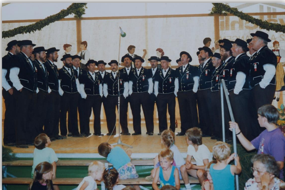
1991 singen die Heimisbacher mit ihrem dazumal neuen heute alten Mutz anlässlich ihres 25-jährigen Bestehens.